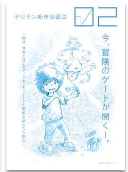
▲左から、テレビアニメ「デジモンゴーストゲーム」 新作映画「02」のティザービジュアル

1999年3月から放送されたテレビアニメ「デジモンアドベンチャー」は、1997年6月にバンダイが発売し、累計800万個以上を販売した携帯型液晶玩具『デジタルモンスター』を基に制作され、シリーズを通して劇場版アニメやコミックなどクロスメディア展開を行ってきました。2020年にはテレビシリーズ「デジモンアドベンチャー:」を皮切りに、「デジモン」シリーズのリブートプロジェクトがスタートしています。バンダイナムコグループ各社では、ユーザーの活動履歴を遊びに変えるウェアラブル端末型液晶玩具『バイタルプレス デジタルモンスター』やTCG(トレーディングカードゲーム)『デジモンカードゲーム』などを発売し、日本国内にとどまらず海外のデジモンシリーズファンの方々にも広く支持されてきました。