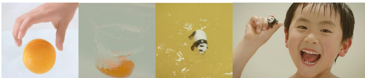
▲「びっくら?たまご」からマスコットが出てくる様子

「びっくら?たまご」シリーズは、2002 年発売開始のマスコット入り入浴剤で、2022 年に 20 周年を迎えました。大好きなキャラクターの魅力と溶けるまで何がでてくるかわからないワクワクドキドキの演出で、子どもたちの毎日の「お風呂」を、特別な体験ができる時間と空間に変えてきました。お風呂での親子のコミュニケーションツールとして 20 年に渡って主にファミリー層にお楽しみいただき、購入されたお客さまからは「子どもが自分からお風呂に入るようになった」、「大好きなキャラクターがいっしょだから、お風呂が楽しい」という声がアンケート等で多く寄せられています。また、入浴剤を使用したことがある 12 才までの子ども 6 千人に向けて、「これまで何の入浴剤を使用したことがあるのか」というアンケートを取ったところ、16%の子どもが「びっくら?たまご」を使用したことがあると回答しました。(弊社調べ)本シリーズではこれまでに、集めて合体できるマスコットや、手足を動かして遊べるマスコットの他、特別な日やギフト需要に向けた通常よりも約 1.5 倍大きなサイズの「びっくら?たまご DX」など、よりお客さまに楽しんでいただける商品を展開しています。