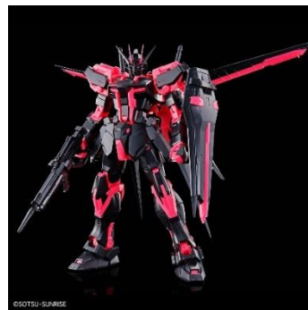
イベント限定 MG 1/100 エールストライクガンダム Ver.RM [リサーチキュレーションカラー/ネオンピンク] 価格: 4,950 円(税 10%込)