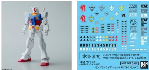
ガンプラトライアルキット RX-78-2 ガンダム+「GUNDAM NEXT FUTURE」オリジナルマーキングシール

※「ガンプラトライアルキット RX-78-2 ガンダム」は「GUNDAM NEXT FUTURE」オリジナルではありません。