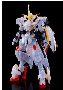
イベント限定 はじろほし HG 1/144 ガンダム端白星[クリアカラー] 価格: 1,650 円(税 10%込)