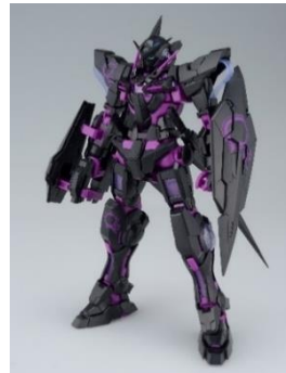
イベント限定 MG 1/100 ガンダムエクシア [リサーチキュレーションカラー/ネオンパープル] 価格: 4,510 円(税 10%込)