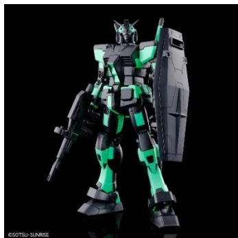
イベント限定 MG 1/100 RX-78-2 ガンダム Ver.3.0 [リサーチキュレーションカラー/ネオングリーン] 価格: 5,280 円(税 10%込)