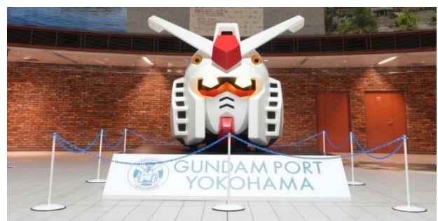
※画像は「GUNDAM PORT YOKOHAMA」での展示写真となります。