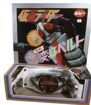
▲ 『仮面ライダー 光る回る 電動変身ベルト』 (1971年)

バンダイの子会社であった株式会社ポピー（現在はバンダイに吸収合併）の社員が、当時他社で販売していた「仮面ライダー」の変身ベルトを子どもに買い与えたところ、「これはテレビに出てくるものとはちがう」と言われ、その言葉をきっかけに、より本物に近い機能を持った商品が企画されました。そして、1971年に『仮面ライダー 光る回る 電動変身ベルト』としてポピーが商品を発売すると、TV番組同様のギミックや斬新なパッケージデザインが話題となり、番組の放映中に380万個販売するという大ヒット商品となりました。バンダイはこの経験を通じ、現在に至るまでテレビに登場する本物のベルトを忠実に再現した、子どもの憧れを形にする「ホンモノ志向」のモノづくりを徹底しています。