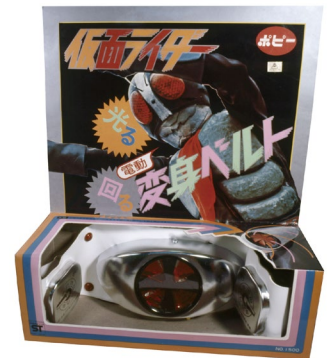
▲ 『仮面ライダー 光る回る 電動変身ベルト』 (1971年)

バンダイの子会社であった株式会社ポピー（現在はバンダイに吸収合併）の社員が、当時他社で販売していた「仮面ライダー」の変身ベルトを子どもに買い与えたところ、「これはテレビに出てくるものとはちがう」と言われ、その言葉をきっかけに、より本物に近い機能を持った商品が企画されました。そして、1971年に『仮面ライダー 光る回る 電動変身ベルト』としてポピーが商品を発売すると、TV番組同様のギミックや斬新なパッケージデザインが話題となり、番組の放映中に380万個販売するという大ヒット商品となりました。バンダイはこの経験を通じ、現在に至るまでテレビに登場する本物のベルトを忠実に再現した、子どもの憧れを形にする「ホンモノ志向」のモノづくりを徹底しています。