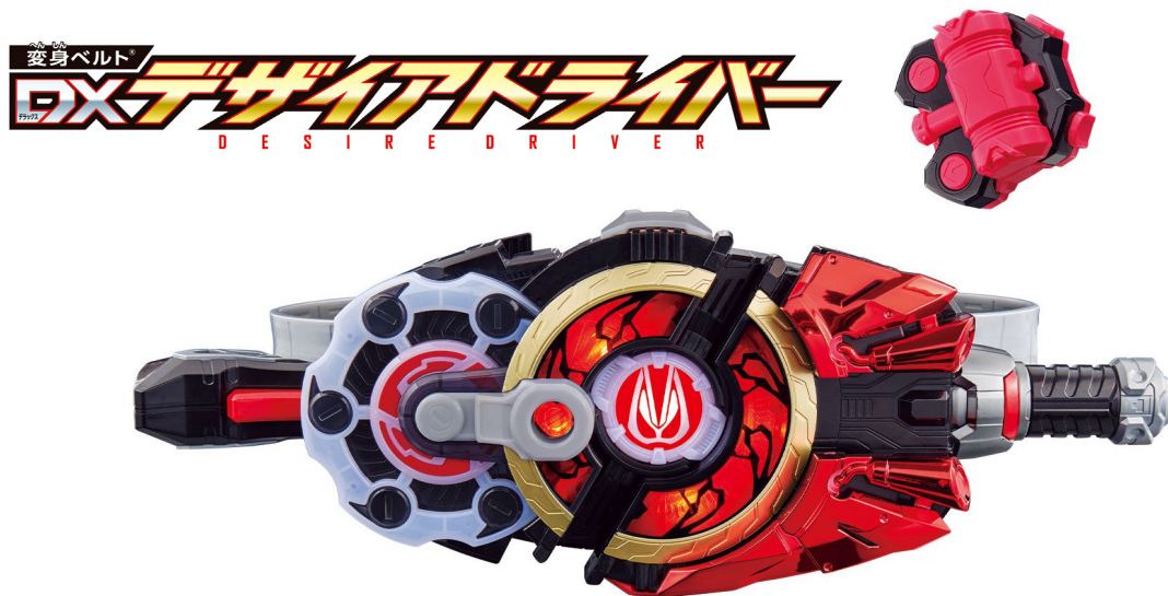
▲『変身ベルト® DX デザイアドライバー』

株式会社バンダイ(代表取締役社長:竹中一博、本社:東京都台東区)は、仮面ライダーシリーズ最新作の「仮面ライダーギーツ」<テレビ朝日系、2022年9月4日(日)より毎週日曜日午前9時～>の放送開始に先駆け、『変身ベルト® DX デザイアドライバー』(7,920円・税10%込/7,200円・税抜)を、2022年9月3日(土)に発売します。主な販売ルートは全国の玩具店、百貨店・家電量販店の玩具売場、雑貨店、オンラインショップなどで、メインターゲット層は3～6歳のお子さまです。また、全国の玩具売場やオンラインショップなどにて2022年8月20日(土)より購入予約を開始します。