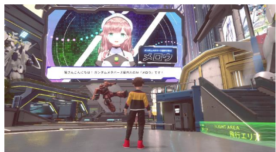
<自動翻訳 イメージ画像>