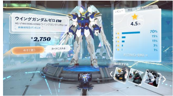
<EC ショップ イメージ画像>