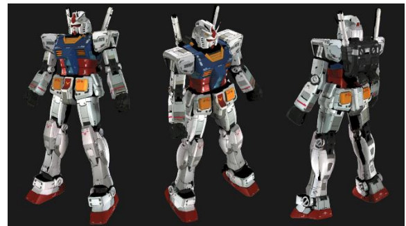
<スマートフォンスキャン イメージ画像>