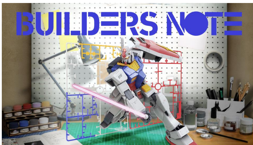
<ビルダーズノート イメージ画像>

「ビルダーズノート」は、自分で製作したガンプラの写真を投稿したり、コメントをつけたりできる機能を搭載いたします。また、販売されているガンプラの商品情報を一覧で確認することや、商品情報を自身の投稿と紐づけることで、ファンの皆さまのガンプラ活動を記録・管理できる予定です。