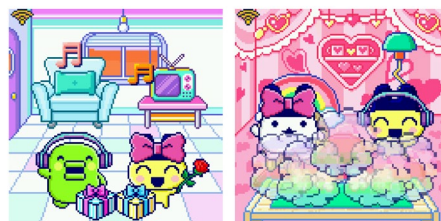
▲友達と「ツーしん」で一緒に遊べる様子

Wi-Fi を使用して接続するクラウドには AWS を利用しています。AWS は日本政府の「政府情報システムのためのセキュリティ評価制度 (ISMAP)」※の認定を受けた最初のクラウドサービス事業者の 1 つです。