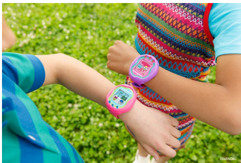
▲通信機能「ツーしん」の様子

『Tamagotchi Uni』同士を直接通信する機能「ツーしん」することで、たまごっちたちと一緒に遊ばせたり、アイテムを交換したり、おそろいのアクセサリを作ったりできるほか、「ツーしん」したたまごっちとパートナーになるとレアなたまごっちに成長することがあります。