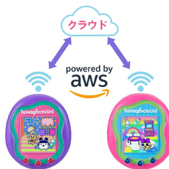
▲たまごっちたちのメタバース“Tamaverse”