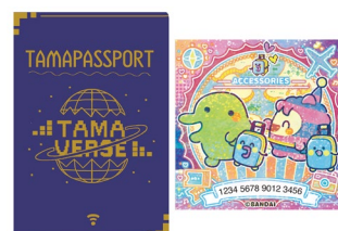
▲(左)たまパスポート (右)たまステッカー