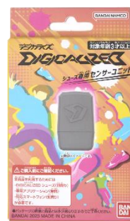
▲『DIGICALIZED』シューズ専用 センサーユニット