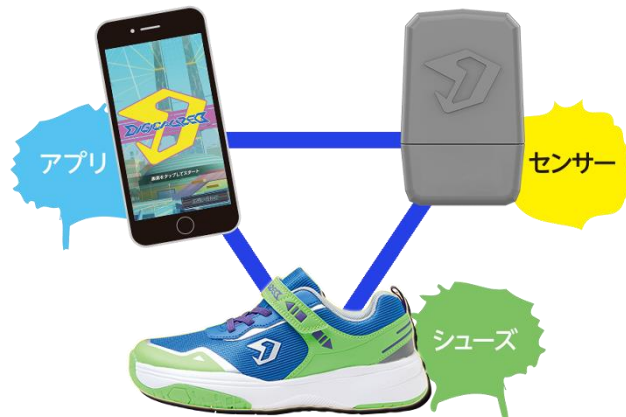
▲『DIGICALIZED』シューズ専用 センサーユニットと専用アプリ『DIGICALIZED』アプリの連携

本商品は、コロナ禍の影響で外遊び機会が減少し運動不足が増長したと言われる子どもたち向けの“超体感型スマートシューズ”です。『DIGICALIZED』 デジカライズ シューズのインソールの下にあるセンサーポケットに『DIGICALIZED』 デジカライズ シューズ専用 センサーユニットを入れ、センサーと専用アプリ『DIGICALIZED』 デジカライズ アプリを連携させて使用します。アプリ内のアバターとともに各種体感アクティビティをプレイすることで、子どもたちに継続的な運動を促し、楽しみながら健康になってもらうことを目的としています。