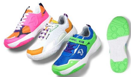
▲『DIGICALIZED』シューズ(通常モデル)