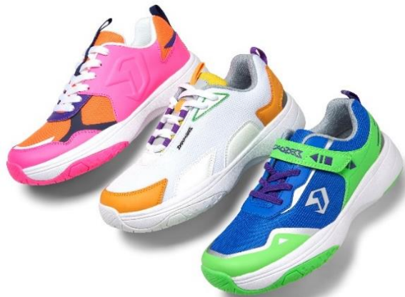
▲『DIGICALIZED』シューズ(通常モデル)

株式会社バンダイ(代表取締役社長:竹中 一博 本社:東京都台東区)は「ゲームアプリを活用し、楽しく運動を継続してもらうこと」を目指した運動用スマートシューズ『DIGICALIZED』 デジカライズ シューズ(全12種 4,950円・税10%込～/4,500円・税抜～)と、同シューズ向け『DIGICALIZED』 デジカライズ シューズ専用 センサーユニット(3,300円・税10%込/3,000円・税抜)を2023年7月15日(土)に全国のイオン系シューズ販売店 Greenbox、ASBee、ASBeeKIDSにて販売開始します(沖縄の一部店舗除く)。また、同サービスを利用するための専用アプリ『DIGICALIZED』 デジカライズ アプリを2023年7月6日(木)12:00頃より順次無料配信予定です。